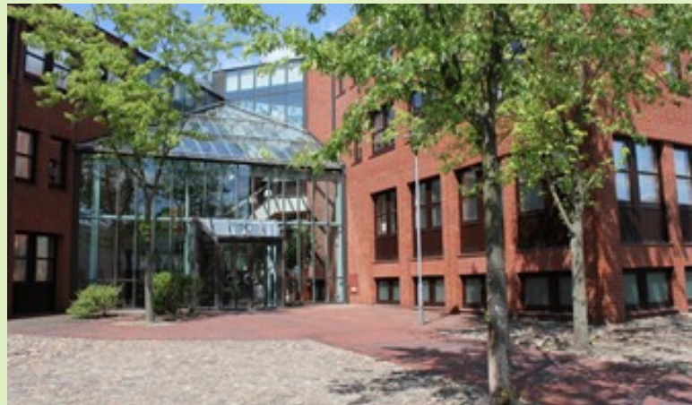
Das Kreishaus in Lüchow