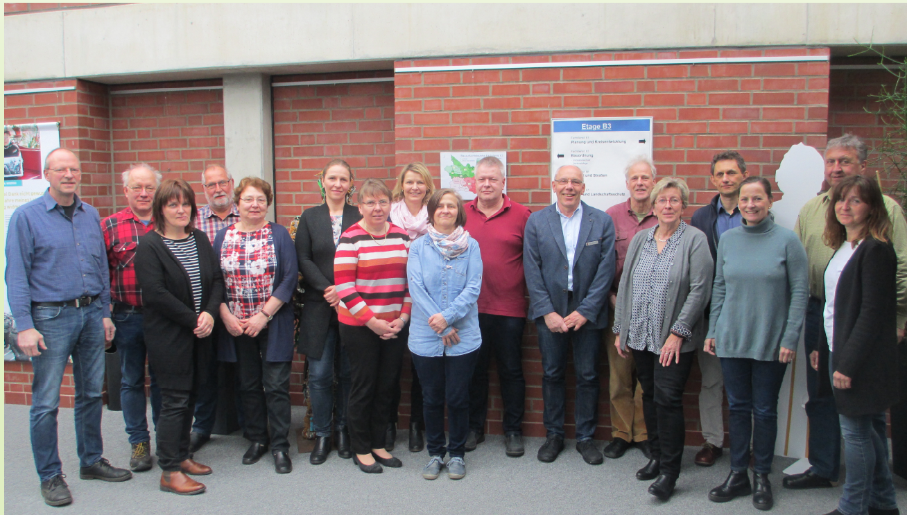
Das Team des Fachdienstes